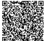
専用フォーム 二次元コード

【お申込み専用フォーム】 https://forms.gle/ijcD75oHvgC51ZpT9 申込期間 2025 年 11 月 4 日(火)~2025 年 11 月 21 日(金)